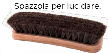
Spazzola per lucidare.