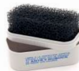
Spugna per Ante e Nubuk.