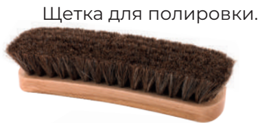
Щетка для полировки.