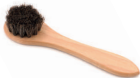
Щетка для нанесения крема.