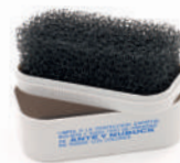
Губка для изделий из замши и нубука.

Комплект для ухода за обувью. Включает в себя: Коробка с эксклюзивным дизайном Masaltos.com. Прозрачный или бесцветный крем для обуви. Крем черного цвета для обуви. Кисть для нанесения крема. Кисть для придания блеска обуви. Ткань для чистки и полировки обуви. Футляр для хранения средств по уходу.